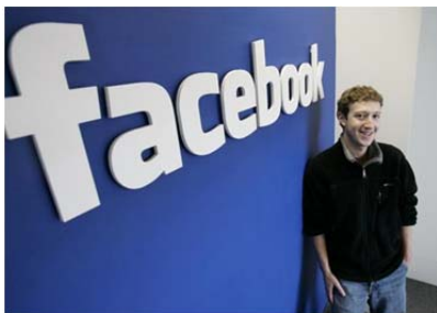
ภาพที่ 1 ภาพ มาร์ก ซักเคอร์เบิร์ก