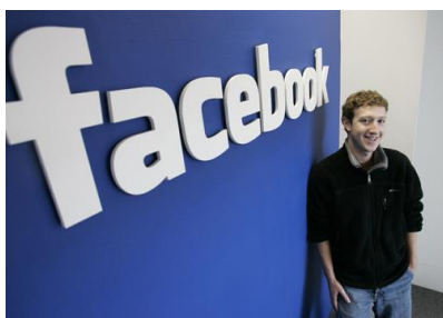
ภาพที่ 1 ภาพ มาร์ก ซักเคอร์เบิร์ก